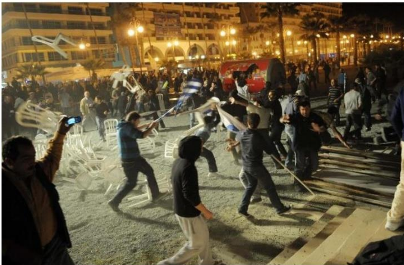
Ακροδεξιοί επιτίθενται στο φεστιβάλ Rainbow στην Λάρνακα, 5/11/10.